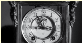
CLOCK (2014) Durada: 4 min