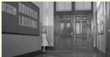
MOVIES 02 (2014) Durada: 4 min