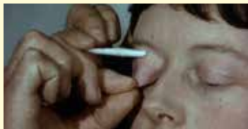
MEDICAL 1 (2015) Durada: 4 min