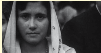
WOE AND REVOLUTION (2014) Durada: 4 min