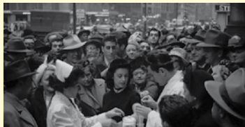
STREET SCENES (2014) Durada: 4 min