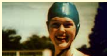
AERIALS (2014) Durada: 6 min