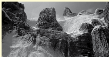
MOVIES 01 (2014) Durada: 4 min